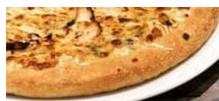
PÂTE ÉPAISSE ET MOELLEUSE 26 CM

AU CHOIX PÂTE ÉPAISSE ET MOELLEUSE OU FINE ET CROUSTILLANTE +3.50 € PÂTE CHEESE CRUST : FROMAGE FONDANT DANS LA PÂTE !